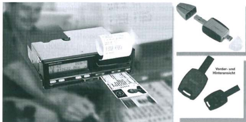
Abb. 2: Datenausgabe und Downloadkeys

Neben der sog. Fahrerkarte , die eine Speicherkapazität von etwa 28 Tagen bei durchschnittlichem Fahrbetrieb besitzt, existieren noch Unternehmens-, Kontroll- und Werkstattkarten , die ggf. auch parallel zur Fahrerkarte in einen der beiden Karteneinschübe des Gerätes gesteckt werden können. Die Unternehmenskarte berechtigt zum Ausdrucken und Herunterladen der dem Unternehmen zugeordneten Daten sowie der Daten auf der Fahrerkarte. Die Kontrollkarte steht den staatlichen Überwachungsorganen (z.B. Polizei) zur Verfügung und ermöglicht das Auslesen der Daten von der Fahrerkarte und aus dem Speicher des Tachografen. Schließlich besitzen autorisierte Werkstätten eine Werkstattkarte, mit der die Programmierung, Kalibrierung und Überprüfung des Gerätes möglich ist. Für Sachverständige ist keine Karte vorgesehen. Sie werden nach Verkehrsunfällen i.d.R. auf die Mithilfe der Polizei angewiesen sein oder das Gerät ausbauen müssen. Daten aus dem Gerät können von berechtigten Personen mit dem integrierten Drucker auf einem Papierstreifen ausgegeben oder per Downloadkey – einem in das Gerät einsteckbaren externen Speicher – heruntergeladen werden.